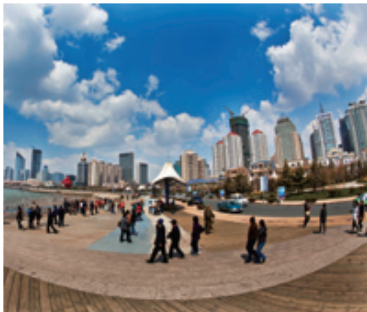
Циндао – город, удобный для проживания

Учитывая нынешнюю ситуацию чрезмерного развития урбанизации, Центральное правительство начало разрабатывать план регионального деления стратегического характера при условии пространственного ограничения, рационально распределяя и корректируя отношения между численностью населения, землей, окружающей средой и социально-экономическим развитием, чтобы надлежащим образом управлять темпами урбанизации в Китае. В сфере градостроительства Китай придерживается принципа «строго ограничивать масштабы крупных городов, рационально развивать средние и активно строить малые города». Начиная с конца 80-х гг. XX века, в КНР наблюдается стремительное развитие средних (с населением от 200 тыс. чел. до 500 тыс. чел.) и малых (менее 200 тыс. чел.) городов. Вокруг городов с миллионным населением планомерно и целенаправленно строятся города-спутники для рас-