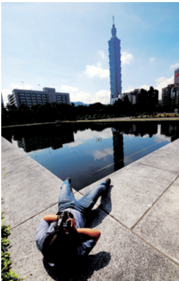
Турист фотографирует небоскреб №101 в Тайбэе

За 60 с лишним лет Коммунистическая партия Китая и китайское правительство прилагали неустанные усилия к решению тайваньского вопроса и осуществлению воссоединения Родины, содействуя непрерывному улучшению и развитию межбереговых отношений. Центральный руково-