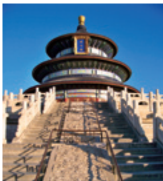
Зал «Циняньдянь» (Зал молитв об урожае) в Храме Неба

Пекин – самый главный финансовый и торговый центр в Китае, многие транснациональные фирмы учредили здесь свои представительства. 30 из 500 крупных в мире фирм учредили здесь свои штаб-квартиры, что вывело Пекин по глобальности на второе место. Пекин является единственным в Китае внутренним городом, вошедшим в 15 мировых закупочных центров, он насчитывает свыше 100 крупных торговых центров. Проспект Ванфуцзин, Дашилань на Цяньмэне и Сиданьская торговая улица являются традиционными в Пекине торговыми районами; торговый город «Гомао», торговый центр «Дунфан Синьтяньди» и пассаж «Чжунгуаньцунь» поднялись и завоевали известность в последние годы.