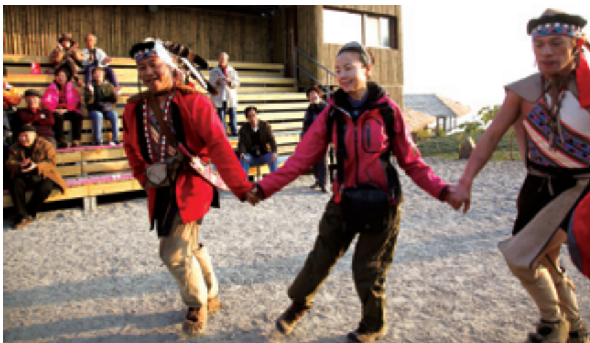
В горном районе Алишань на Тайване туристы из материковой части Китая танцуют вместе с артистами из числа коренных жителей