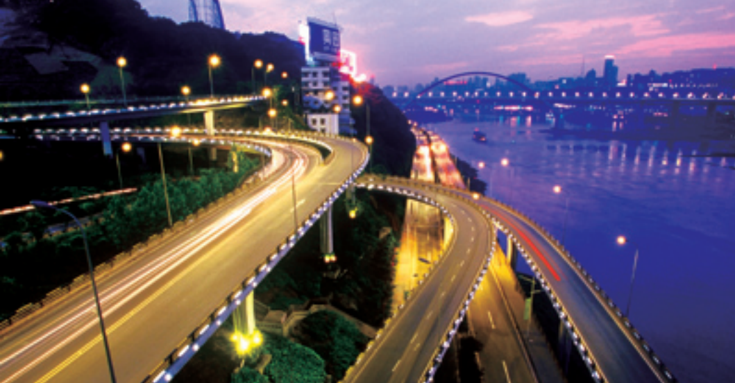
Чунцин – город в горах