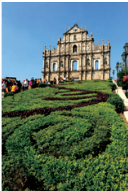
Передняя стена Собора Св. Павла в Аомэне (кит. «Дасаньба»)

ной деятельности, независимыми юридическими правами и правом на вынесение окончательного судебного приговора. В настоящее время главой администрации ОАР Аомэнь является Цуй Шиань, на флаге ОАР Аомэнь – изображение цветущего лотоса.