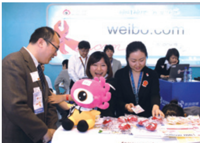
На Международной конференции в области мобильных VAC и мобильного Интернета стенд «Микроблоги 'Синьлан'» привлек большое внимание посетителей

СМИ одни за другими работали в интернете. Многие известные в стране сайты работают в режиме средств массовой информации, заявляя о собственных преимуществах благодаря эксклюзивному подбору публикаций.