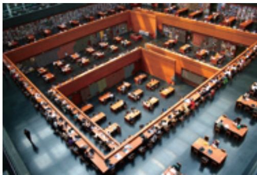
Современная Национальная библиотека

Национальная библиотека, в которой хранится 27 млн. экз. книг и 250 ТВ цифровых ресурсов, является самой крупной в Азии. Особая литература насчитывает 730 тыс. экз. книг, по количеству и качеству письменности на черепашьих панцирях и костях, дуньхуанского наследства, местной летописи и рукописям известных людей Национальная библиотека стоит среди библиотек в стране и даже мировых библиотек в первых рядах. Как главное государственное книгохранилище, Национальная библиотека имеет абсолютную часть современных изданий. Национальная библиотека является также самым крупным в стране коллекционером литературы на иностранных языках, которая насчитывает 10,776 млн. экз. книг. С 1916 г. библиотека является официальным государственным книгохранилищем. С 1987 г. она принимает на хранение отечественные электронные издания. При библиотеке функционируют Национальный центр каталога книг (ISSN) Китая и Информационный центр компьютерных сетей. В настоящее время Национальная библиотека вместе с многочисленными библиотеками страны входит в союз библиотек цифровых изданий, способствуя развитию услуг в сфере цифровых массмедиа в Китае. Национальная цифровая библиотека имеет 13 цифровых хранилищ – электронную библиотеку, хранилище периодических изданий, хранилище редкой