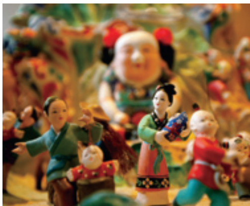
Глиняные человеческие фигуры «Хуэйшань»

селений. Они разбросаны повсюду на широких просторах страны, представляя редкое в мире явление. В этих местах сохранилась первозданная природа, множество предметов народных промыслов, исторических и фольклорно-этнографических материалов. Ведомства по охране памятников старины планируют расширить масштаб работы по охране древних поселений.