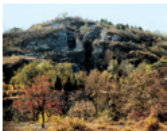
Стоянка пекинского синантропа «Чжоукоудянь»