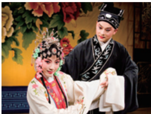
Китай известен разнообразными местными операми

Премия цветов сливы является высшей наградой в театральных кругах Китая.