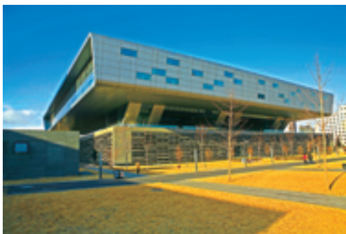
Тихий уголок на территории Национальной библиотеки

В последние годы непрерывно расширяются и углубляются реформы в системе культуры, улучшаются услуги общественной культуры, обогащается и ассортимент культурной продукции. За прошедшие пять лет в основном выполнены задачи по переходу единиц издания,