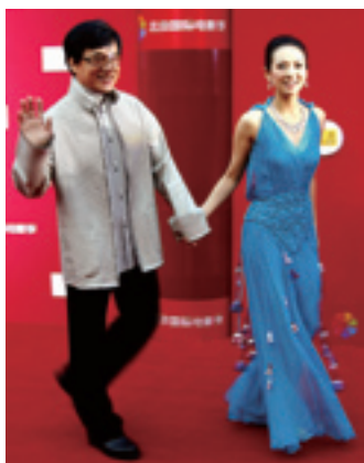
Открытие первого Пекинского международного кинофестиваля стало свидетельством процветания китайского кинематографа