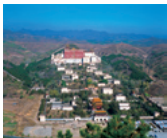
Восемь внешних храмов – «Вайбамяо» в Чэндэ