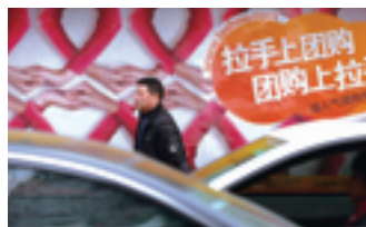
Уличная реклама группового шоппинга через сайт «Рука об руку»

С середины 90-х гг. XX в. сетевые порталы начали сотрудничать с традиционными СМИ, сегодня существующие