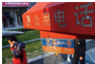
Общественные телефонные будки с WIFI