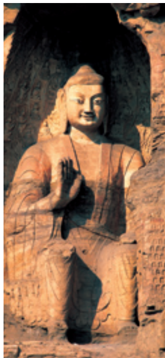
Каменные пещеры «Юньган» в пров. Шаньси

В 2004 г. была начата первая масштабная реставрация 6 памятников мирового наследия на территории Пекина – могил 13 минских императоров, Великой китайской стены, музея Гугун, храма Неба, парка Ихэюань и стоянки пекинского синантропа «Чжоукоудянь» и ныне все реставрационные работы уже завершены. В 2006 г. в Китае вторая суббота июня была объявлена Днем культурного наследия и отмечается ежегодно.