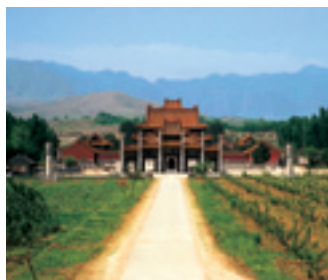
Императорские могилы династии Цин