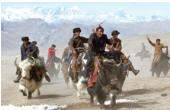
На яках на Цинхай-Тибетском нагорье