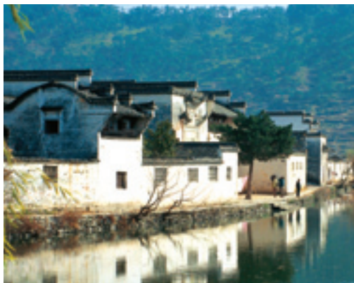
Древнее поселение в пров. Аньхуэй – деревня Хунцунь

В Китае насчитывается более 800 тыс. памятников культуры, часть из которых относится к категории подземных (захоронения и проч.). Число опубликованных важных культурных памятников, взятых под государственную охрану, увеличилось до 2351. Реестры культурных памятников, находящихся под охраной администраций на уровне провинций, насчитывают свыше 8831 единиц, под охраной городов и уездов – более 58371. В 2015 г. будет создан Государственный банк