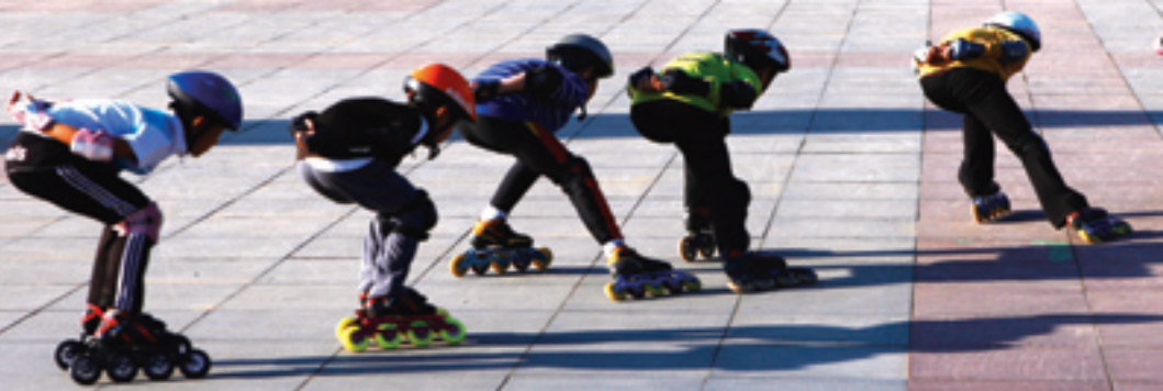
Мальши на роликах

в физкультурно-оздоровительных мероприятиях, владел двумя и более способами укрепления здоровья и раз в год проходил диспансеризацию.