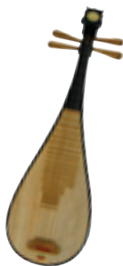
Пипа (китайская четырёхструнная гитара)