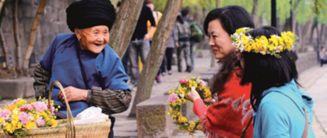
Радостная прогулка в пригороде