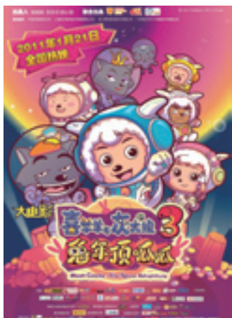
Мультфильм «Козлик Сиянъян и волк Хуэйтайлан» пользуется огромной популярностью в Китае