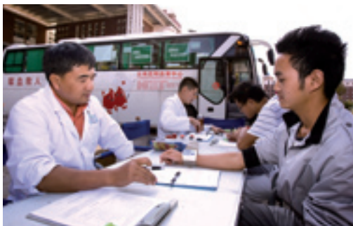
Медицинский осмотр перед сдачей крови

В Китае на каждую тысячу человек приходится в среднем 1,75 врача и 3,31 больничной койки. В Пекине, Шанхае, Тяньцзине, Чунцине и других крупных городах имеется большое количество специализированных (онкологических, кардиологических, офтальмологических, стоматологических и др.) и общих клиник, а также клиник традиционной китайской медицины. В средних городах провинций и автономных районов также работают комплексные и специализированные больницы