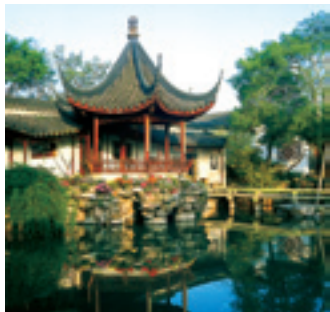
Архитектурно-парковые ансамбли в Сучжоу