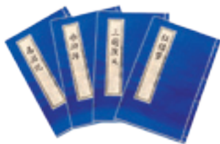
Романы «Сон в красном тереме», «Троецарствие», «Речные заводи» и «Путешествие на Запад» являются четырьмя классическими литературными произведениями Китая

В 80 – 90 гг. XX века вышли произведения новых писателей, ставшие известные всему миру, что свидетельствует о больших достижениях и расцвете современной литературы Китая. Эти писатели простым языком раскрывают духовный мир современных китайцев, передают их переживания и чувства, тем самым проявляя высокое творческое мастерство. Судя по общему уровню литературного творчества, можно сказать, что современные писатели достигли более значительного прогресса по сравнению с