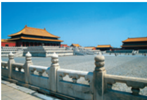
Музей Гугун, бывший ранее императорским дворцом, известен богатыми культурно-историческими памятниками

Расположенный на восточной стороне площади Тяньаньмэнь в Пекине Национальный музей обладает функциями сбора исторических документов, архео-