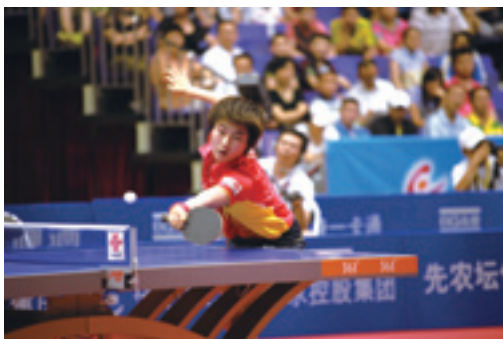
Пинг-понг является важной атлетической дисциплиной в Китае

2004 г. Госсовет КНР опубликовал «Положение о борьбе с допингом», впервые в деталях предусмотрев процедуру антидопингового контроля, обязательства в области борьбы с допингом, проверку и анализ на допинг, ответственность перед законом и т. д.