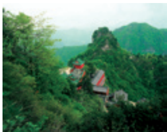
Ансамбль древней архитектуры в горах Уданшань