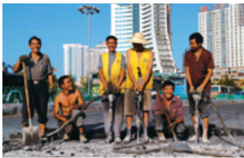
6 рабочих-мигрантов из числа крестьян на стройплощадке

В Программе двенадцатой пятилетки впервые выдвинута преимущественная стратегия по трудоустройству. В сфере отраслевой и экономической структур упор сделан на развитие экономических отраслей и производственное обслуживание, благоприятствующих увеличению трудоустройства и освоению людских ресурсов. Это означает, что в будущем правительство предпримет еще более активную политику по трудоустройству, расширит масштабы трудоустройства и создания дела, в частности, будет главным образом решать вопрос трудоустройства выпускников вузов, приехавшей на заработки сельской трудовой силы и горожан, испытывающих трудности.