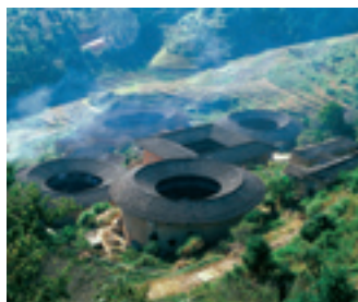
Земляные постройки «Тулоу»