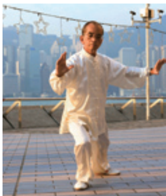
Китайская гимнастика «тайцзицюань», соединяющая мягкость с твердостью

У представителей различных народностей Китая есть свои национальные виды