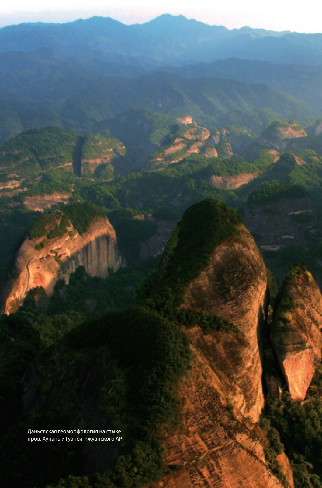
Даньсякая геоморфология на стыке пров. Хунань и Гуанси-Чжуанского АР