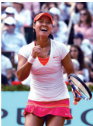
Ли На стала чемпионкой Открытого чемпионата Франции по теннису в 2011 году

Блестящие результаты в спорте – результат совершенствования системы тренировок, основой которой являются любительские спортивные школы для подростков и низовые спортивные клубы, костяком – спортивные команды провинций, автономных районов и городов центрального подчинения, а высшим звеном – сборная страны. Такая система тренировок позволяет постоянно поддерживать количество отличных спортсменов по всей стране на уровне около 20 тыс. человек, которые становятся основной силой в покорении вершин мирового спорта. 3 февраля