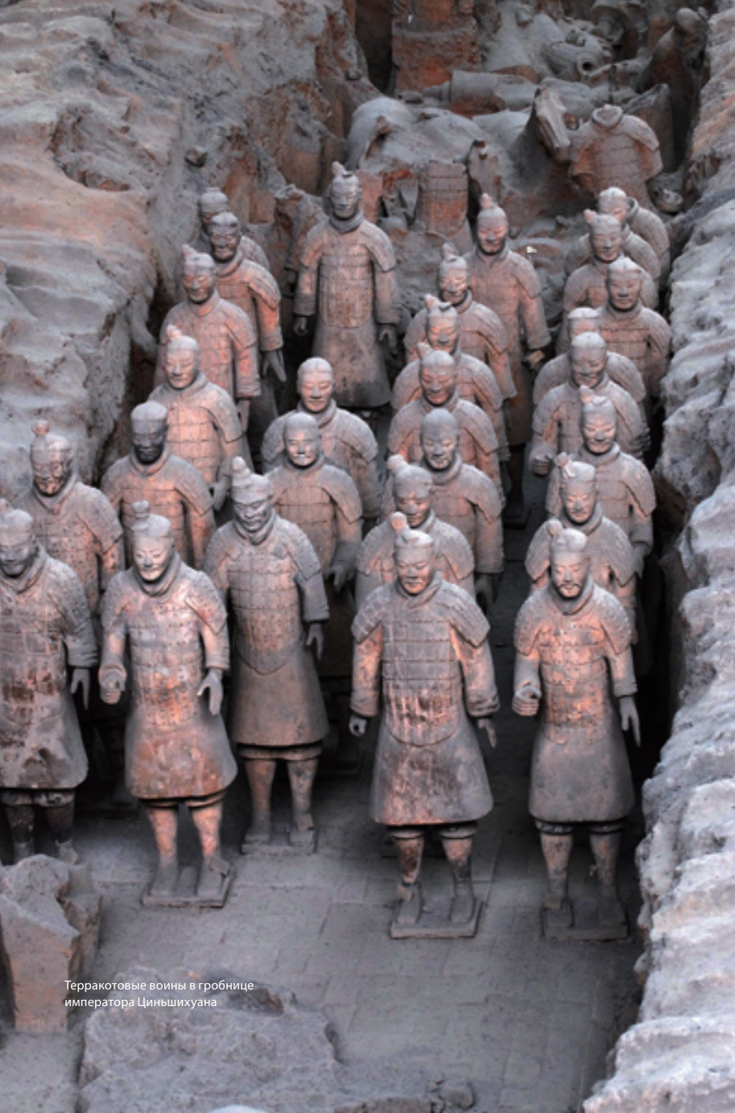
Терракотовые воины в гробнице императора Циньшихуана