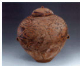
Расписной керамический сосуд, насчитывающий несколько тысячелетий

Китай является одной из древнейших мировых цивилизаций. Согласно письменным источникам, он насчитывает почти 4000-летнюю историю. На неолитических стоянках Хэмуду в г. Юйяо (пров. Чжэцзян) и Баньпо в г. Сиань (пров. Шэньси), существовавших 6-7 тысячелетий назад, археологами были обнаружены культивируемые неочищенные рис и чумиза, а также сельскохозяйственные орудия. Около 5000 лет назад китайцы владели технологией отливки изделий из бронзы. Существовавшая более 4000 лет назад династия Ся (2070 – 1600 гг. до н. э.) является древнейшей династией Китая. Более 3000 лет назад в эпоху Шан (1600 – 1046 гг. до н. э.) начали использоваться железные орудия труда; свыше 2000 лет назад в эпоху Чжоу (1046 – 256 гг. до н. э.) появилась технология отливки стали. В периоды Весны и Осени и Воюющих царств (770 – 221 гг. до н. э.) наблюдалось небывалое доселе оживление философской мысли, появилась целая плеяда выдающихся философов – Лаоцзы, Конфуций, Мэнцзы, Ханьфэйцзы, а также известный военный деятель Сунь У, которые оказали значительное влияние на последующие поколения.