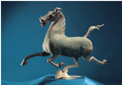
Бронзовая лошадь династии Восточная Хань

С XVII по XVIII вв. самый знаменитый император династии Цин (1644 – 1911 гг.) – император Канси (1654 – 1722 гг.) присоединил Тайвань, сдержал экспансию Царской России и установил режим окончательного назначения центральным правительством наместников в Тибете. Во время его правления территория Китая на-