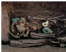
Древние нефритовые изделия, обнаруженные при раскопках