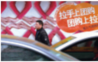
Publicité pour un site d'achats groupés.