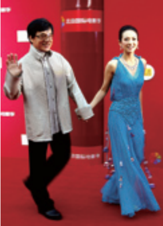
La première saison internationale du film à Beijing.

la peinture traditionnelle chinoise et de la peinture occidentale, produisent des œuvres de styles variés. L'art contemporain, qui utilise les matières, les formes, les supports et les moyens modernes, évolue rapidement ; les œuvres artistiques issues des nouveaux médias, comme la vidéofréquence, le numérique, les dessins animés et l'art acoustique, sont fréquemment présentes dans les expositions contemporaines chinoises et étrangères.