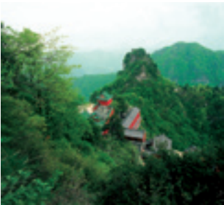
Ensemble des bâtiments anciens des montagnes de Wudang.