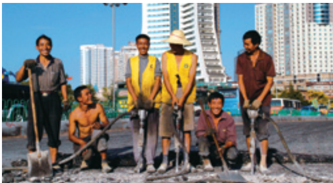
Six « frères » ruraux engagés dans la construction urbaine.

Le programme du XII e Plan quinquennal a proposé pour la première fois de mettre à exécution la stratégie accordant la priorité à l'emploi, et de prêter attention, en ce qui concerne les structures industrielles et économiques, au développement des secteurs économiques et des domaines de production et de service favorisant l'augmentation de l'emploi ainsi qu'une exploitation et une utilisation des ressources humaines. Cela signifie que le gouvernement mènera des politiques pour l'emploi plus actives en multipliant les programmes de création d'emploi et d'entreprise, en mettant l'accent sur la