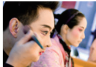
Maquillage avant la représentation.

Le kunqu , appelé aussi kunju , vieux de plus de 500 ans, était l'opéra représentatif sous les dynasties des Ming et des Qing. En tant que l'un des biens du « patrimoine oral et immatériel de l'humanité », il a remporté le succès esthétique le plus remarquable parmi tous les opéras de Chine. Il se distingue notamment par son lyrisme, ses gestes subtiles et son chant entraînant, mélodieux et doux. Ses pièces les plus classiques sont le Pavillon aux pivoines et le Palais de l'éternité .