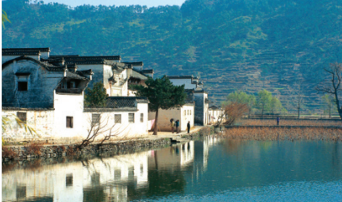
Hongcun, village ancien de l'Anhui.

concernant la protection des monuments historiques. La Loi sur la protection des reliques culturelles , publiée en 1982, a édicté des règles précises concernant les monuments historiques, les fouilles archéologiques, les collections des musées, les collections privées, et l'import-export des pièces archéologiques. En 2003, ont été élaborés les Règlements concernant la mise en application de la Loi sur la protection des reliques culturelles , et les Règlements provisoires sur la gestion de la vente aux enchères des objets d'art . En 2006, les premiers règlements spéciaux relatifs à la protection d'un patrimoine culturel unique, appelés les Règlements sur la protection de la Grande Muraille , ont été élaborés.