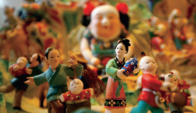
Figurines de Huishan.

patrimoine culturel immatériel au niveau national, qui comprend dix catégories : la littérature folklorique, la musique folklorique, la danse folklorique, le théâtre traditionnel, les spectacles populaires, l'acrobatie et le sport traditionnel de compétition, les beaux-arts folkloriques, l'art artisanal, la médecine et la pharmacopée traditionnelles, les mœurs, et regroupe 518 articles.