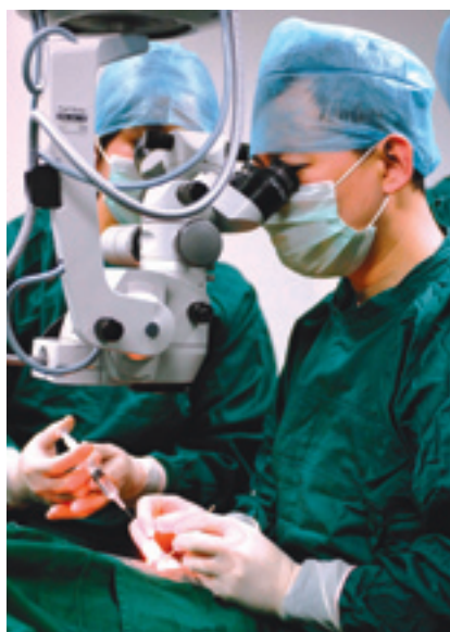
Transplantation de cornée.

Depuis l'approfondissement de la réforme du système pharmaceutique et sanitaire en 2009, le nombre des cotisants à l'assurance