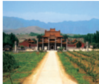
Une tombe impériale des Qing.