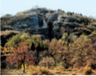
Site de l'Homme de Pékin à Zhoukoudian.