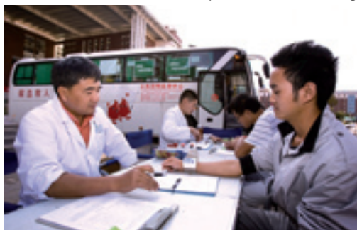
Examen médical précédant un don du sang.

On compte en Chine 1,75 médecin et 3,31 lits pour mille personnes. Dans les métropoles comme Beijing, Shanghai, Tianjin et Chongqing, ont été construits de nombreux hôpitaux généraux et différents hôpitaux spécialisés de haut niveau disposant de services anticancéreux, cardio-cérébrovasculaires, ophtalmologiques et odontalgiques, de services de médecine traditionnelle chinoise et de services de maladies contagieuses ; dans les villes de moyenne importance de toutes les provinces