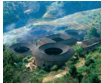
Maisons de terre au Fujian.