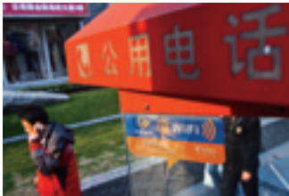
Cabine téléphonique portant le signe WIFI.

Le Grand prix des films en chinois ont quant à eux contribué au développement du cinéma chinois.