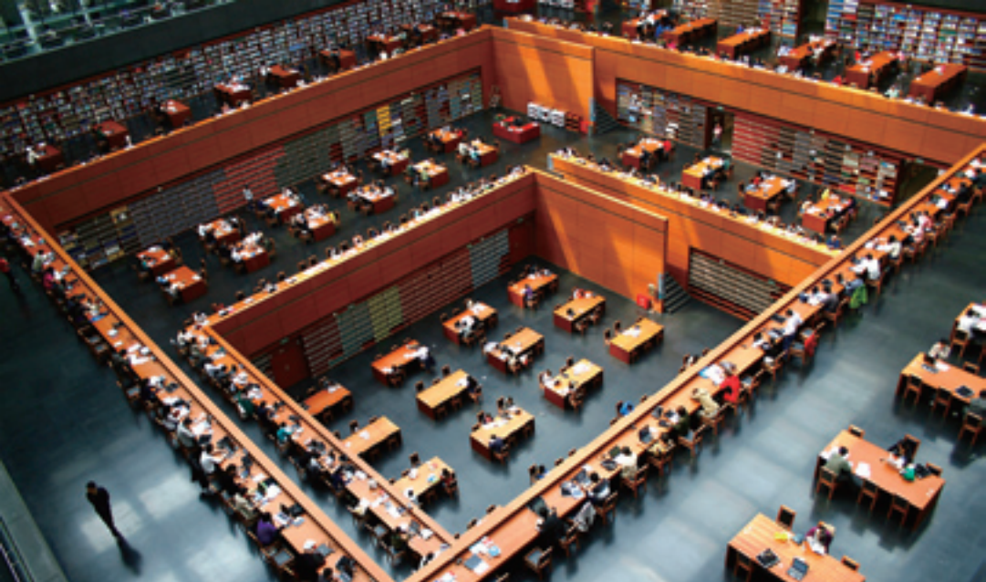
Salles de lecture de la Bibliothèque nationale.

entier pour ses 730 000 documents exceptionnels ainsi que pour la quantité et la qualité de ses carapaces de tortue et os d'animaux, ses livres découverts dans les grottes de Dunhuang, ses monographies locales et ses manuscrits de grands écrivains. En tant que dépôt national, la Bibliothèque nationale de Chine conserve la majorité des livres et périodiques contemporains. Elle réunit le plus grand nombre de documents en langues étrangères, avec 10 776 000 livres et périodiques étrangers. A partir de 1916, les dons de livres ont afflué de tout le pays, faisant de la bibliothèque une banque nationale de documentation. En 1987, elle s'est vu offrir des publications électroniques. Ici siègent encore le Centre national d'identification des périodiques (ISSN) et le Centre informatique d'Internet. La Bibliothèque nationale a fondé une union des bibliothèques numérisées avec plusieurs bibliothèques chinoises afin de promouvoir le développement et l'application de l'information publique numérisée. La Bibliothèque numérique nationale de Chine compte 13 banques de données couvrant livres, journaux, photos et ouvrages de référence, ce qui permet à la Bibliothèque nationale de répondre aux besoins de stockage de livres pour les 30 ans à venir. La bibliothèque numérique fera de la Bibliothèque nationale de Chine le plus grand centre de documentation et de ressources numériques en chinois du monde, ainsi que la base de services informatiques la plus avancée de Chine.