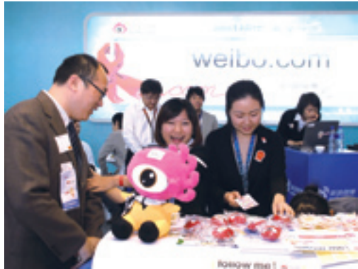
Les microblogs attirent l'attention générale.

Les revues sur Internet se développent rapidement, dépassant les 360 millions d'exemplaires.