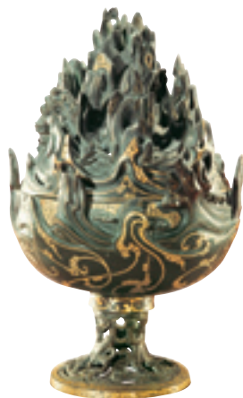
Réchaud en bronze doré datant de la dynastie des Han.