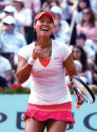
Li Na, championne des Internationaux de France de tennis 2011.

Le tennis de table joue un rôle important dans le sport chinois.