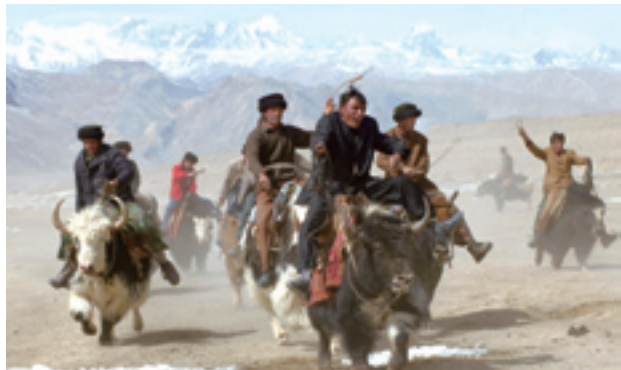
Course de yacks sur le plateau du Qinghai-Tibet.

est de constater le développement physique et le niveau de sport des étudiants, ont commencé en 1982 et se tiennent tous les quatre ans. Les Jeux nationaux des handicapés ont lieu tous les quatre ans depuis 1984. En novembre 1953, se sont déroulés les premiers Jeux nationaux des ethnies minoritaires, avec pour objectif de révéler leurs sports traditionnels au public.