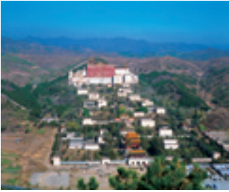
Un temple à Chengde.