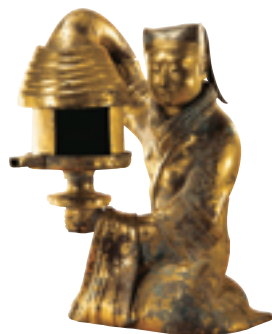
Lanterne en bronze datant de la dynastie des Han.

Le travail de sauvegarde des monuments historiques s'intègre petit à petit dans le système de la légalité. La Chine a adhéré aux quatre conventions internationales