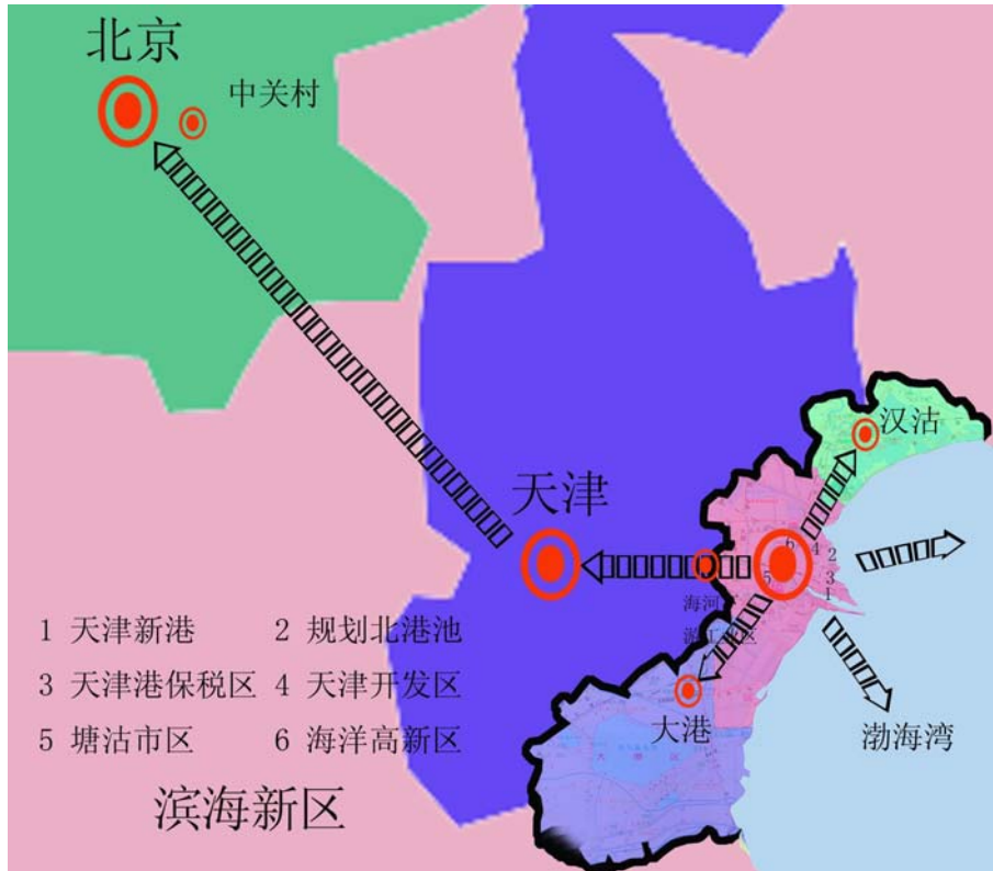
图 2-3 天津滨海新区地域及其扩散示意图

京津塘科技新干线沿线分布和辐射的科技产业园区主要包括：北京中关村高新技术产业园区、北京经济技术开发区、廊坊经济技术开发区、天津武清开发区、天津海洋新技术高新区、天津经济技术开发区和天津港保税区等。天津滨海新区处于京津塘科技新干线的龙头地位，如何发展才能启动京津塘科技新干线，带动中国北方经济大繁荣呢？按照霍特林市场竞争区位模型的分析结论，在同质的线形市场空间分布中，出于竞争的结果，经营同类商品的企业市场区位选择最终会出现空间均衡，也就是说，企业通常会在交通条件最有利的线形空间的中间位置发生集聚。因此，在京津塘科技新干线上，务必要形成一种具备内在技术关联收益和外在市场共享收益的产业链条，这条产业链条既可以获得产业的规模经济优势，又是针对目标市场可细分的和在技术上可分割的；在京津塘科技新干线这种空间离散的生产单元之间建立起自组织机制，形成和谐的整体发展模式；特别注意的是，由于高新技术产业在技术环节上具有链条式发展的特征，因此，在塑造产业带的过程中务必要注重生产空间与行政区划空间的协同和谐关系。所以，根据霍特林市场竞争区位分析结论和空间离散自组织机制理论，首先，要创新政府管理体制，统筹区域发展的合作机制，加快区域资源的实质性整合。统筹天津滨海新区发展的关键，就是要摆脱行政区经济的羁绊，从长远发展的战略眼光和整合发展的思路出发，推动经济资源的合理流动和跨地区的经济合作，以增强区域整体竞