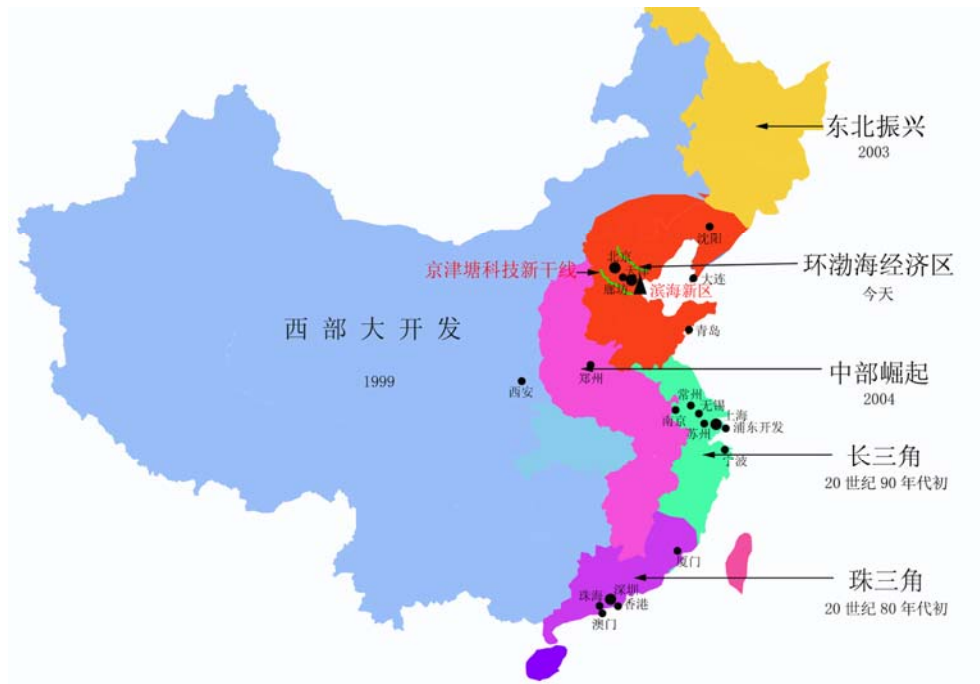
图 2-2 天津滨海新区在中国主要经济增长极及其内部城市布局中的位置示意图

中国要推进经济国际化，必须提升国际竞争力。当代世界大国的核心竞争力集中于城市，尤其高度集中于它的世界级城市群。这些世界级城市群集聚着数十座至上百座城市、数千万城市人口和数以万计的高级人才，有着优越的地理位置、良好的自然环境、合理的城市布局、高效的基础设施和先进的产业结构，具有雄厚的经济实力、发达的生产能力、完善的服务能力、巨大的创新能力和连通全球的交通、信息、经济网络，是控制、协调世界政治、经济、社会、科技、文化活动的中枢。拥有世界级城市群，也就拥有对国际事务的巨大影响力和参与国际竞争的核心竞争力。在全球城市体系中，由于区位因素、人口规模、经济实力、辐射能力等的差异，形成了国家级、国际级、世界级等不同等级的城市群。世界级城市群是最高等级的城市群，处于全球城市体系的顶端。纵观中国经济的每一次大发展也是突破不了在一个区域的城市群发展，这个规律在当前经济发展阶段也是突破不了，在 20 世纪 80 年代深圳开放带动了珠江三角洲的发展，其核心为广州、深圳，周边有香港、澳门、珠海等城市；20 世纪 90 年代浦东大开发拉动了整个长江三角洲的发展，核心为上海，周边有南京、杭州、苏州、无锡、常州等大城市；在 20 世纪末 21 世纪初，环渤海经济圈及其内部的天津高新技术开发区在此期间也获得异乎寻常的发展，这为我国改革开放积累了宝贵的经验，在该经济圈内，有北京、天津两个大城市，周边有廊坊、秦皇岛、唐山、青岛、大连等城市，天津滨海新区要凭借京津和环渤海城市的力量，横空出世（见图 2-2：天津滨海新区在中国主要经济增长极及其内部城市布局中的位置示意图）。