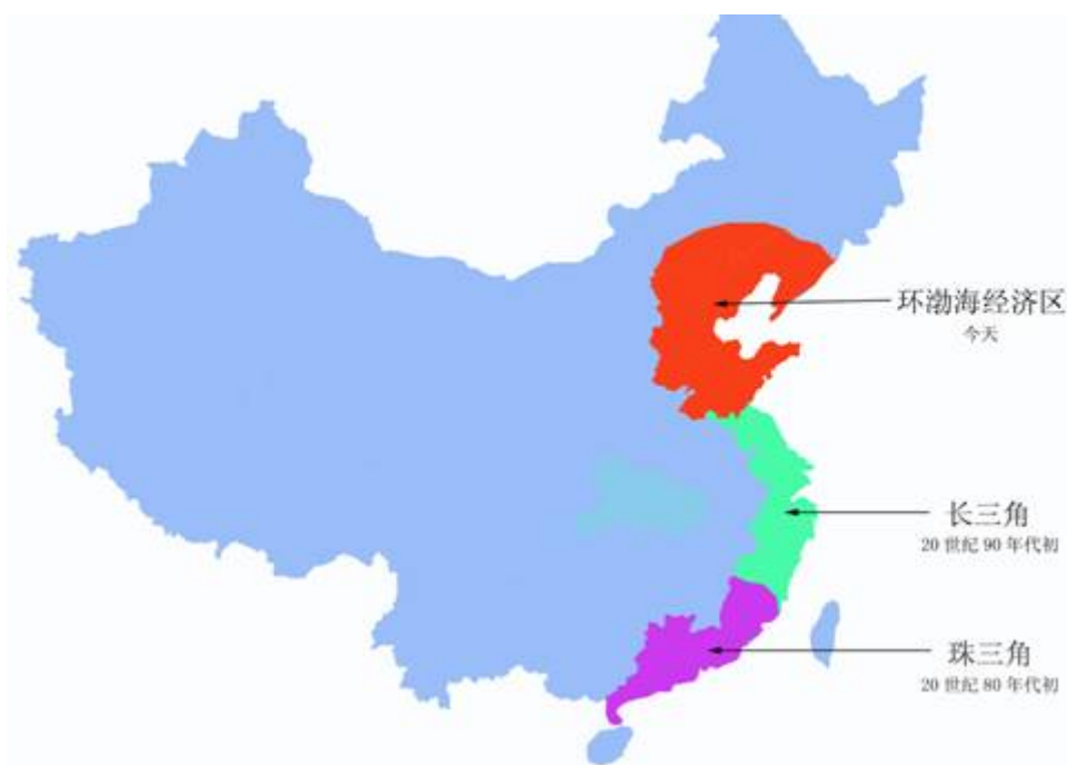
图 5-2 中国的经济增长三级

三极的三极联动，即将在产业分工、比较优势、平等共赢、互通有无等原则上实现合作与竞争，从而带动整个中国经济另外两个“引擎”更快转动，最终是要达到全国协调平衡发展的目标。三极联动如下图所示。在这个过程中，环渤海经济圈大有作为，既可以向先发展的两极学习，也可以发挥比较优势、后发优势，加快自身发展，还应该在此基础上实现互动，与珠三角、长三角共同发挥协同效应。如环渤海经济圈可以凭借其强大的科研力量和新兴纳米技术为其他两极乃至全国提供原创产业；长江三角洲则成为其他两极乃至全国的金融中心，提供国际水准的金融服务和金融市场，支持其他产业发展；珠江三角洲地区可凭借其中小企业、政策优势为其他两极甚至全国提供必需的工业产品。三极分别分布在社会生产的三个不同的主要环节，发挥优势，各尽所长，联动发展。