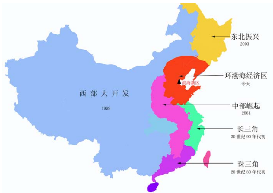
图 5-3 中国整体开发示意图