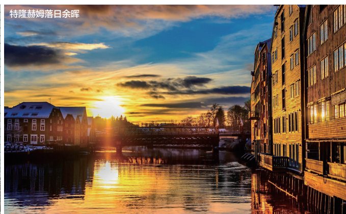
特隆赫姆落日余晖