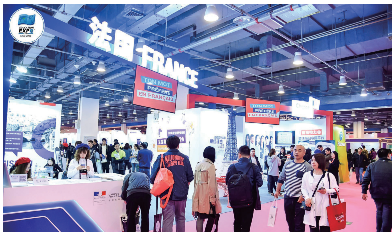
2019 中国国际教育展法国展区