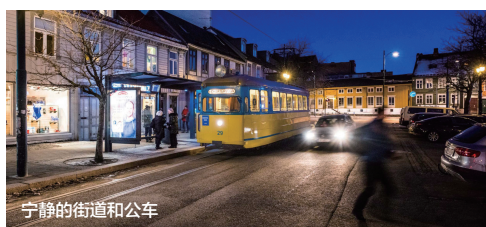
宁静的街道和公车