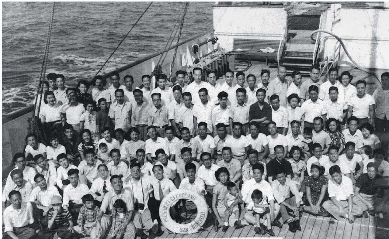
1950年8~9月，130余名留美学人搭乘“威尔逊总统号”客轮返回祖国

1949年中华人民共和国成立前夕，人均GDP仅有27美元，人均寿命不到35岁，人均受教育年限不到1年，约90%是文盲。新中国成立后，我国实施了主要向苏联、东欧地区社会主义国家大量派遣留学人员的重大决策；时至20世纪60年代初期，又拟定了向西方发达国家派遣留学人员的正确方针；进而为新中国的出国留学事业奠定了坚实的政策基础，为中国留学事业的持续发展积累了宝贵的实践经验。十一届三中全会确定实行改革开放政策后，中国逐步制定、不断调整并探索实施了更大规模和全方位派遣出国留学人员的方针政策，为当代出国留学事业的曲折进程与繁荣发展注入新的活力。