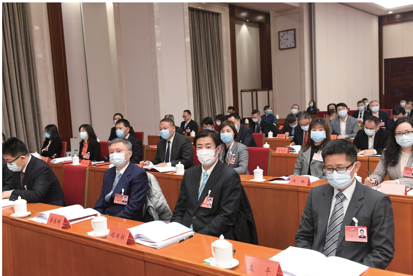
大会现场，代表们认真参会、积极履职。

职尽责，充分发挥作用，进一步团结凝聚广大留学人员，为高质量发展、新时代振兴贡献智慧力量！”