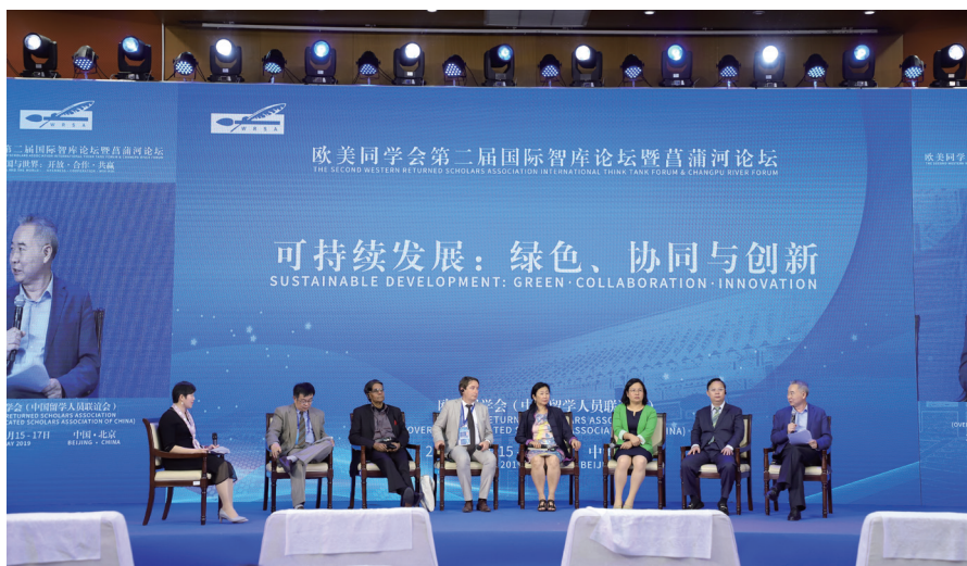
第二届国际智库论坛暨菖蒲河论坛现场

作为一种具有明确外交目的的民间性对外交往和交流活动，民间外交在当代中国的总体外交活动中，始终占有十分重要的位置。实践表明，民间外交的内涵、途径和形式十分丰富。担当开展民间外交的生力军，欧美同学会将牢记嘱托，不辱使命，在民间外交事业的开拓与发展中，迸发更加夺目的璀璨光彩！