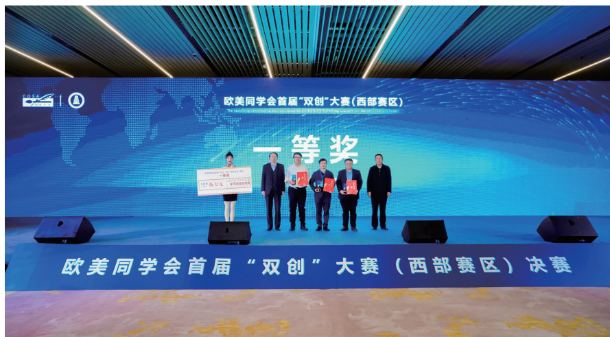
欧美同学会首届“双创”大赛（西部赛区）决赛现场

数据显示，2019年度我国出国留学人员总数为70.35万人，较上一年度增加4.14万人，增长6.25%；各类留学回国人员总数为58.03万人，较上一年度增加6.09万人，增长11.73%。1978