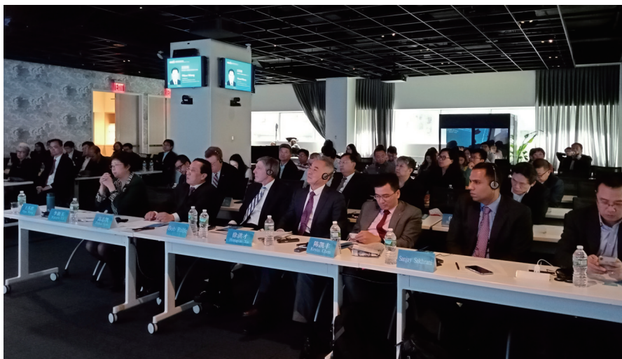
首届中美经贸论坛在纽约举行

该场论坛取得了建设性成果。美方代表认为，欧美同学会来美国举办此次对话非常难得，这有利于美各界进一步