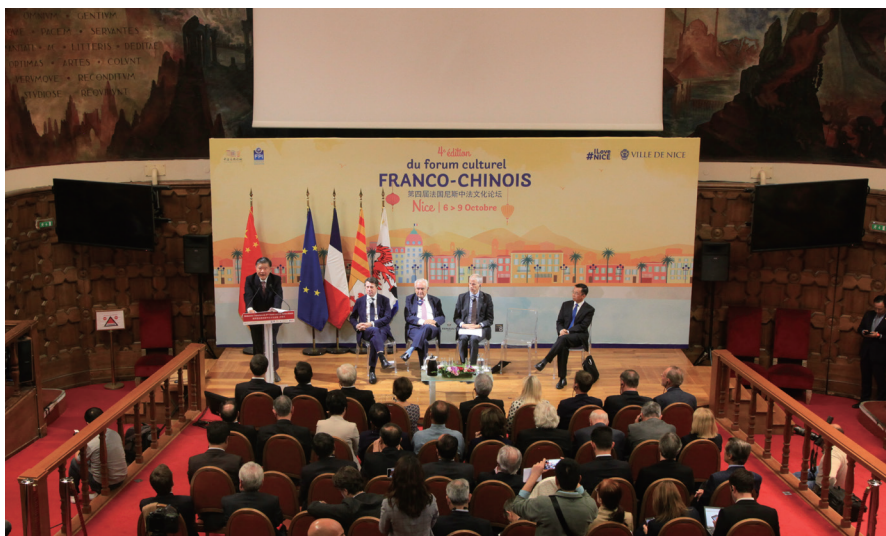
2019 年 10 月，第四届中法文化论坛在法国尼斯举办。

民间外交注重通过民间交流增进人民之间的理解和信任，这种基于人类文明共同理念的交往具有强大生命力和广泛社会基础。随着世界多极化、经济全