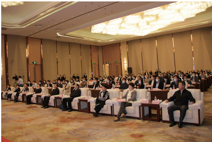
2020年11月5日，欧美同学会在南京召开地方组织建设现场会。

2021年1月21日，欧美同学会召开第一次全国会员代表大会，坚持围绕中心、服务大局总要求，充分发挥“留学报国人才库”“建言献策智囊团”“民间外交生力军”的作用，持续深入推进组织建设，这个面向海内外广大留学人员的组织必将更加有凝聚力、组织力、影响力，在新征程上为实现中华民族伟大复兴的中国梦凝聚起更广泛留学人员的群体力量。■