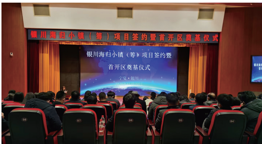
2020年11月20日，欧美同学会海归小镇（筹）首开区签约奠基仪式在宁夏银川苏银产业园举行。

“海归小镇”，是欧美同学会（中国留学人员联谊会）的一项集聚海归人才和海归产业发展的重要规划，计划在全