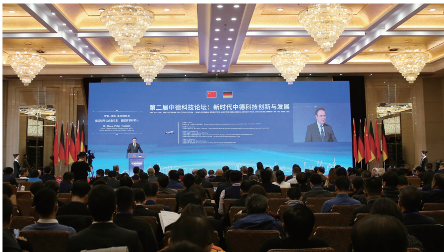
2019年11月19日，第二届中德科技论坛在北京开幕。

“欧美同学会创办‘中德科技文化论坛’，就是为了把自身的人才智力优势与德国的科技优势紧密结合，搭建可持续的两国科技与文化交流合作新平台，