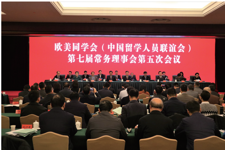
“加强组织建设”成为欧美同学会第七届理事会历次会议上的高频词汇。

统一战线工作条例（试行）》。2020年12月21日，中共中央发布修订后的《中国共产党统一战线工作条例》，再次对相关内容进行了明确。