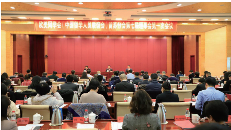
2020年1月，欧美同学会留苏分会第七届理事会第一次会议在京召开。