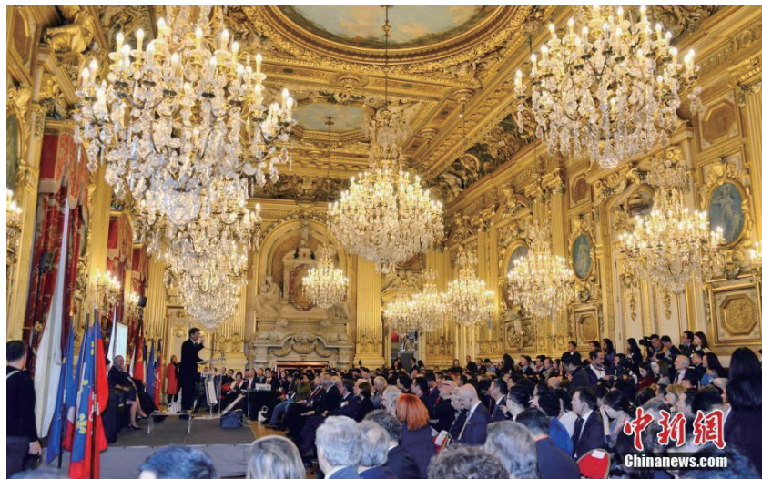
第二届中法文化论坛在法国里昂市政厅开幕

“欧美同学会成立于1913年，百余年来为推动中外友好做了大量有意义的工作。”正如丁仲礼会长在纪念中国公派留学英国50周年论坛致辞中所言，欧美同学会举办此次活动既是百年传统履行历史使命的尝试，也是践行习近平主席要求促进中外交流，尤其是中英交流的友谊实践。未来我们将不断搭建平台载体，继续推动交往和民心相通，为开创中英关系新时代，为人类文明进步做出应有的贡献。★