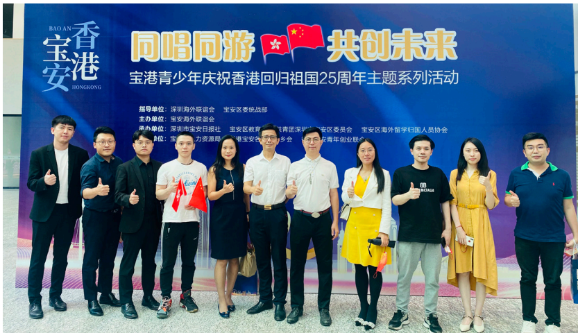
文化创意组参加“同唱同游 共创未来”——宝港青少年庆祝香港回归祖国25周年主题系列活动

现金流管理、战略布局、团队协作等能力体验人生历程；商务健康组则积极开展走访深圳乡情文化基地暨党史学习教育活动，邀请区委党校老师讲述党史，不断吸取前进的智慧和力量；乐享运动组开展的飞盘和篮球运动会活动也受到会员们的热烈欢迎。