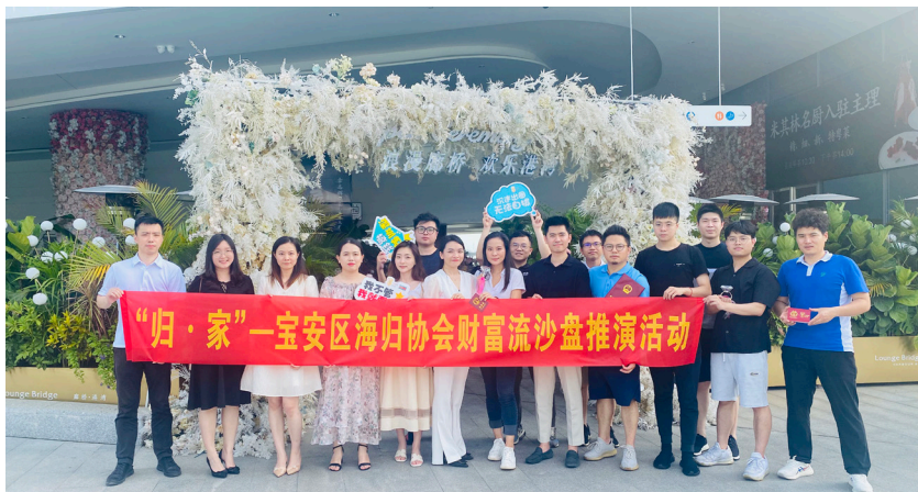
金融投资组开展“归·家”——宝安区海归协会财富流沙盘推演活动

系,开设项目直通车,搭建联动并进、抱团发展、共建共享的交流合作平台……宝安区为海归人才“量体裁衣”制定的展翅计划23条措施可谓“硬核”。自展翅计划开展以来,宝安区委统战部、宝安区海归协会充分发挥桥梁纽带作用,不仅为海归人才提供全方位、贴心、精准的服务,更是让“择良木而栖”的海归人才在宝安的凝聚力进一步增强。