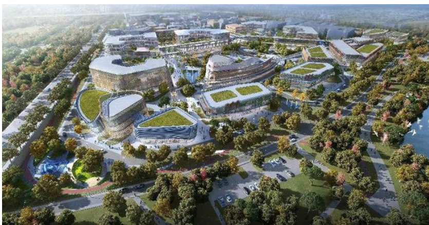
欧美同学会海归小镇（无锡·物联网）一期规划图

按照规划，欧美同学会将围绕国家创新发展战略，在全国范围内选择经济活跃度高、产业前瞻性强的城市，布局建设10个以高科技为支撑的海归小镇。“建设海归小镇，是要把地方经济发展之强、产业需求之强、欧美同学会拥有的国际化人才之强结合起来，强强合作，把有关高新技术产业做得更好，不但可以领先，甚至可以领跑整个产业发展。”欧美同学会党组书记、秘书长王丕君指出，“以产业为依托，主要是为了避免国内有一些产业载体出现的同质化竞争现象。聚焦当地优势核心产业，集中力量助推地方做强做优某一个产业是更高效的产业园发展模式。一个地方聚焦一个产业，每个产业背后都关联着一条完整的产业链。如果产业园片面追求园内领域‘包罗万象’，就有可能在建设过程中出现种种推进乏力、