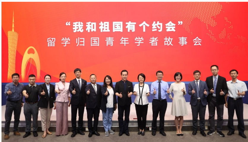
2022年5月21日，举行“我和祖国有个约会——留学归国青年学者故事会”

指导委员会、分会开展丰富多彩的会员活动。积极引导各委员会、分会发挥留学人员专长，让联系服务工作更加深入基层、更加贴近社会所需，建设温暖的留学人员之家。例如，社服委学长向广州市白云区一所中学捐赠爱心图书共百余册，搭建“广州欧美同学会爱心书柜”并定期开展公益讲座；青年委牵头组织“乘风破浪·共赢未来”海归嘉年华活动、“关爱长者，爱心送暖”公益捐赠活动等。