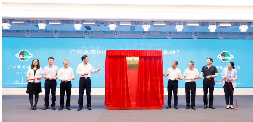
2022年6月16日，广州欧美同学会“云帆计划实践基地”——粤港澳大湾区海归之家揭牌

广州欧美同学会将坚持以习近平新时代中国特色社会主义思想为指导，深入贯彻党的二十大精神和习近平总书记对广东系列重要讲话和重要指示批示精神，坚持贯彻新发展理念，坚持以留学人员为主体，坚持发扬爱国主义精神，以健全组织体系为基础，以扩大组织覆盖为重点，以提升组织效能是关键，充分发挥“留学报国人才库、建言献策智囊团、民间外交生力军”作用，为助力广州加快建设具有独特魅力和发展活力的国际大都市，为服务广东省在全面建设社会主义现代化国家新征程中实现走在全国前列、创造新的辉煌总定位总目标，为全面建设社会主义现代化国家、实现中华民族伟大复兴贡献智慧和力量。★