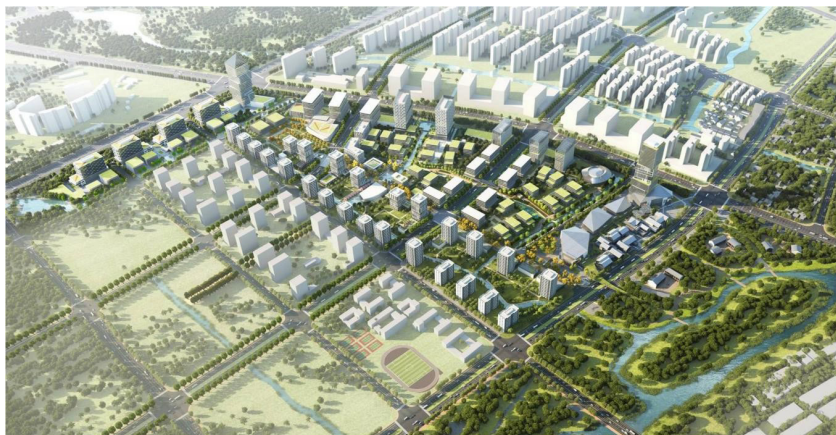
欧美同学会海归小镇（无锡·物联网）二期规划图

无锡的海归高层次人才，在人才首次认定后5年内在无锡市区范围（不含江阴宜兴）自费购买首套自住商品房，给予10万至500万购房补贴。符合条件的创新创业领军