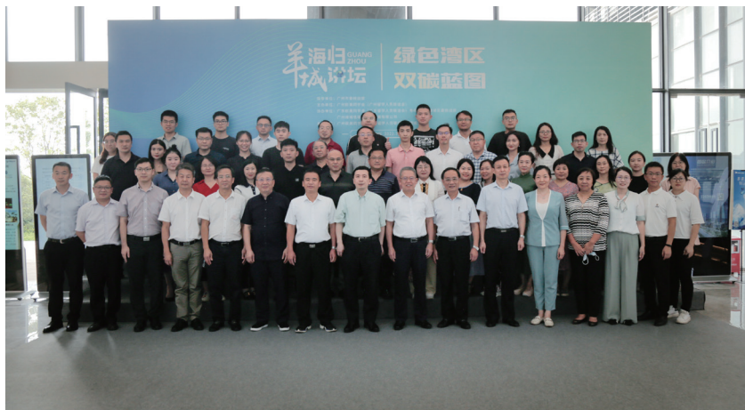
2022年7月28日，举行“绿色湾区 双碳蓝图”羊城海归讲坛活动

培训课程，务求不断提升留学人员的思想政治水平，逐步培养留学人员讲好中国故事、湾区故事、广州故事的能力。2022年6月，在香港回归祖国25周年之际和国务院《广州南沙深化面向世界的粤港澳全面合作总体方案》公布前后，举办了“广州欧美同学会理事和会员骨干培训班”，专题开展国际形势与国家安全知识、粤港澳大湾区建设、广州经济运行情况等方面的学习，帮助留学人员建立“国际——国内”“湾区——广州”的政策理论框架。2022年7月，在全国人大常委会副委员长、欧美同学会会长丁仲礼院士首场“欧美同学会大讲堂”授课的一个月后，广州欧美同学会即举办“绿色湾区 双碳蓝图”——羊城海归讲坛活动，专题学习研讨习近平生态文明思想，具体聚焦“碳达峰、碳中和”目标下粤港澳大湾区的规划蓝图和发展机遇。两场培训都因为切中了当下的热点，吸引了高校和企业的留学人员踊跃参加。下一步，广州欧美同学会将进一步总结和巩固前期经验，围绕习近平总书记关于加强和改进国际传播的重要思想和关于传承中华优秀传统文化和文化遗产保护等重要思想组织专题培训，不断加强留学人员对习近平新时代中国特色社会主义思想的学习，帮助留学人员拓展自身知识结构，不断提高政治站位，增进政治共识。