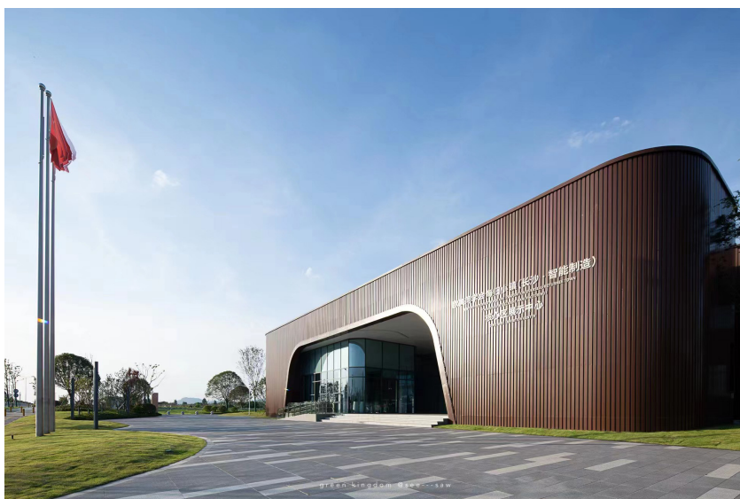
欧美同学会海归小镇（长沙·智能制造）核心区展示中心效果图

以先进制造业为代表的实体经济，就是长沙经济高质量发展的根基，智能制造已成为长沙的新名片！