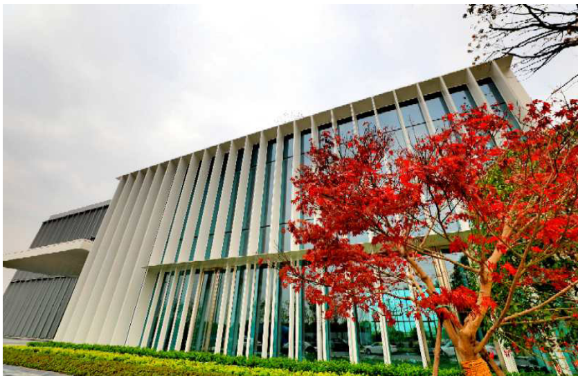
欧美同学会海归小镇（杭州·数字医药）规划展示中心

验中心五位一体的“四区一中心”空间格局，建立“快速启动区+核心承载区+辐射带动区”的“三区联动”发展模式。