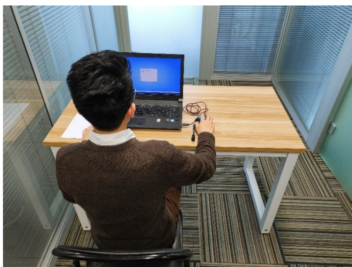
图二：电脑端背面视角