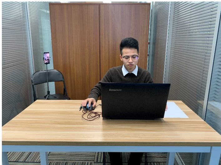
图一：电脑端正面视角

定在能够拍摄到考生桌面、考生电脑桌面、周围环境及考生行为的位置上继续拍摄（详见说明书中《智考通操作手册》《智考云在线考试规范》）。